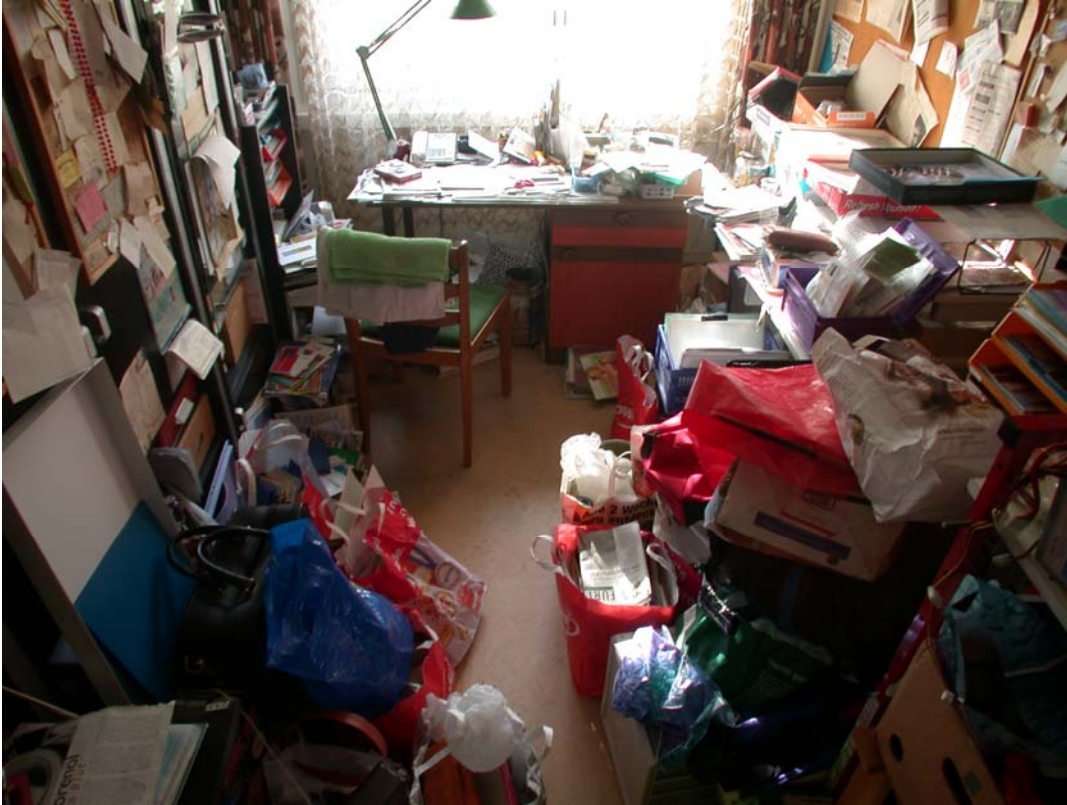
Bild 1: Messie-Wohnung: Viele Dinge – alle irgendwie noch brauchbar

Bei verwahrlosten Menschen dagegen sammelt sich nicht bloss das noch irgendwie Brauchbare an, sondern auch der Müll. Die Betroffenen vegetieren dahin unter Entbehrung der allernötigsten Einrichtungen wie Kochgelegenheit und sanitären Anlagen. Die Wohnung wird nicht selten unbewohnbar. Mit gewissen ästhetischen und geruchlichen Nebenerscheinungen, um es vornehm zu sagen (Bild 2).